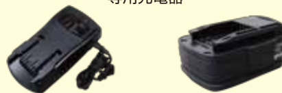
●充電器 SI-DC20UN37-30A ●バッテリーパック SI-B2045LA