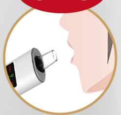
約5-10秒吹きかけるだけ