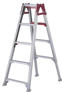
平地でもご使用できます。