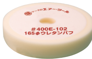
Φ165 ウレタンバフ 外径165×内径30×厚34mm